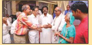
લાભાર્થી પરિવારનું સન્માન