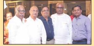
પહેડીમાં ઉપસ્થિત ભાવિકજનો અને ગણમાન્ય અતિથિઓ