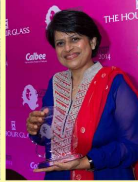
પ્રકાશ સમીક્ષાના હાર્દિક અભિનંદન...