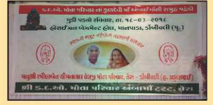
માતાજીની પહેડીનું ડેકોરેશન અને લાભાર્થી પરિવાર